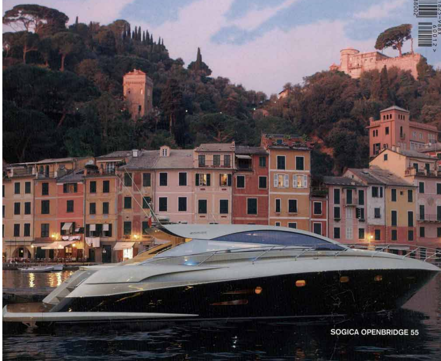
SOGICA OPENBRIDGE 55